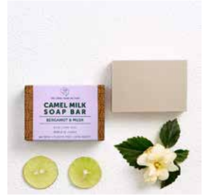
Bergamot & Musk