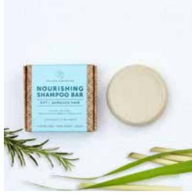
Nourishing Shampoo Rosemary, Sidr & Lemongrass