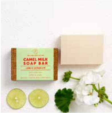
Lime & Geranium