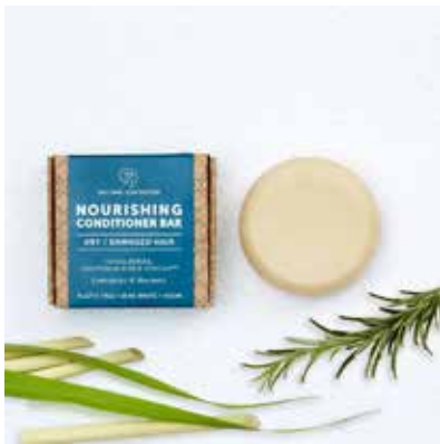
Nourishing Conditioner Rosemary, Sidr & Lemongrass