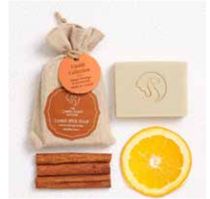
Sweet Orange & Cinnamon