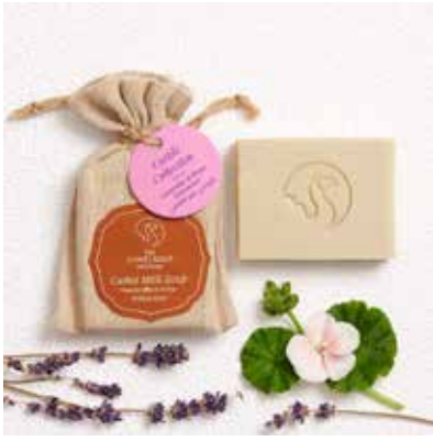
Lavender & Rose Geranium

Please click on product for more information