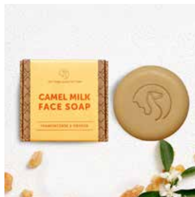
Frankincense & Orange