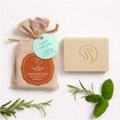
Rosemary & Peppermint