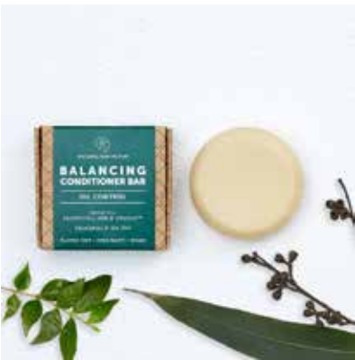
Balancing Conditioner Eucalyptus, Sidr & Tea Tree