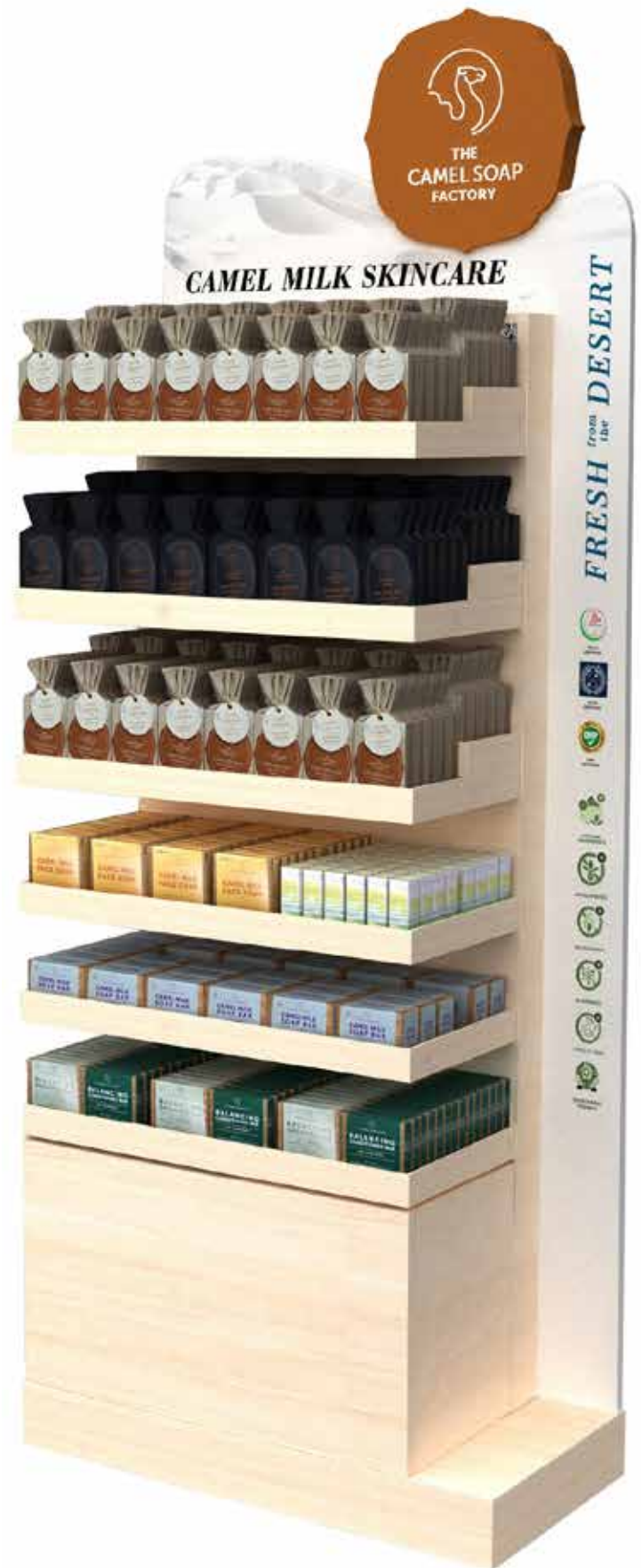
Full Collection Floor Stand (H) 170 cm x (L) 63 cm x (D) 30 cm