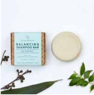
Balancing Shampoo Eucalyptus, Sidr & Tea Tree