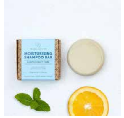
Moisturising Shampoo Peppermint, Sidr & Orange