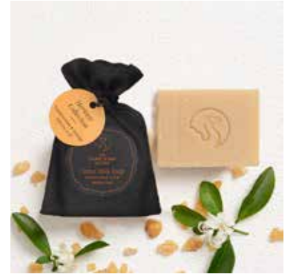
Frankincense & Orange