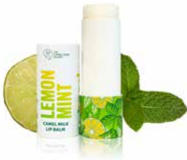
Lemon & Mint

Please click on product for more information