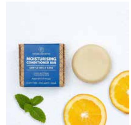
Moisturising Conditioner Peppermint, Sidr & Orange