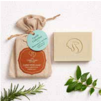
Rosemary & Tea Tree