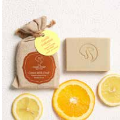
Sweet Orange & Lemon