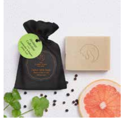
Coriander & Pepper