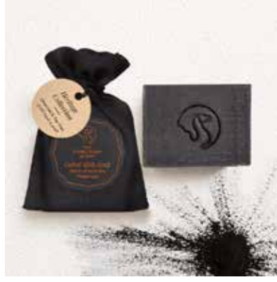
Charcoal & Tea Tree