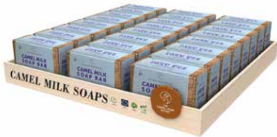
Milled Soap Counter Stand (H) 3 cm x (L) 31 cm x (D) 32 cm