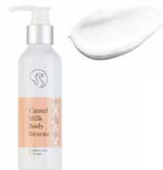
Body Rescue Cream