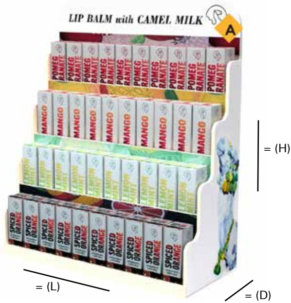
Lip Balm Counter Stand (H) 34 cm x (L) 25 cm x (D) 12 cm