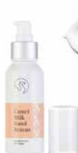
Hand Rescue Cream