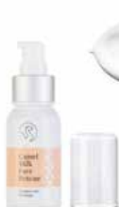
Face Rescue Cream

Please click on product for more information