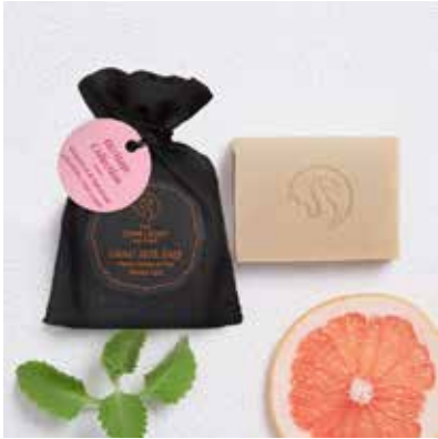
Grapefruit & Patchouli