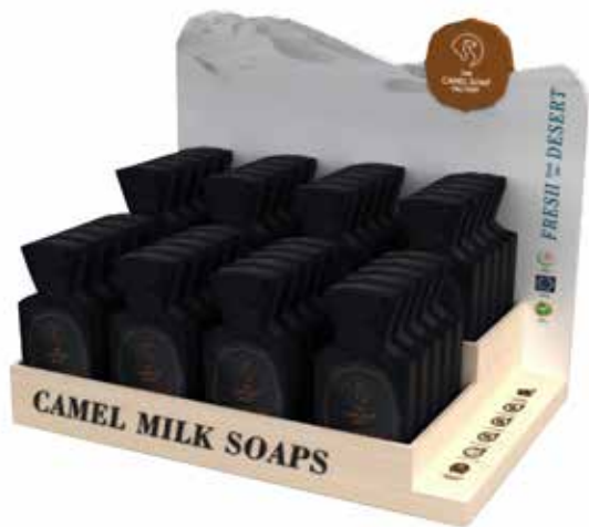
Handmade Soap Counter Stand (H) 30 cm x (L) 28 cm x (D) 20 cm