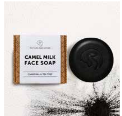
Charcoal & Tea Tree